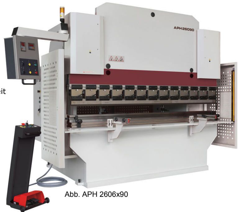
Abb. APH 2606x90