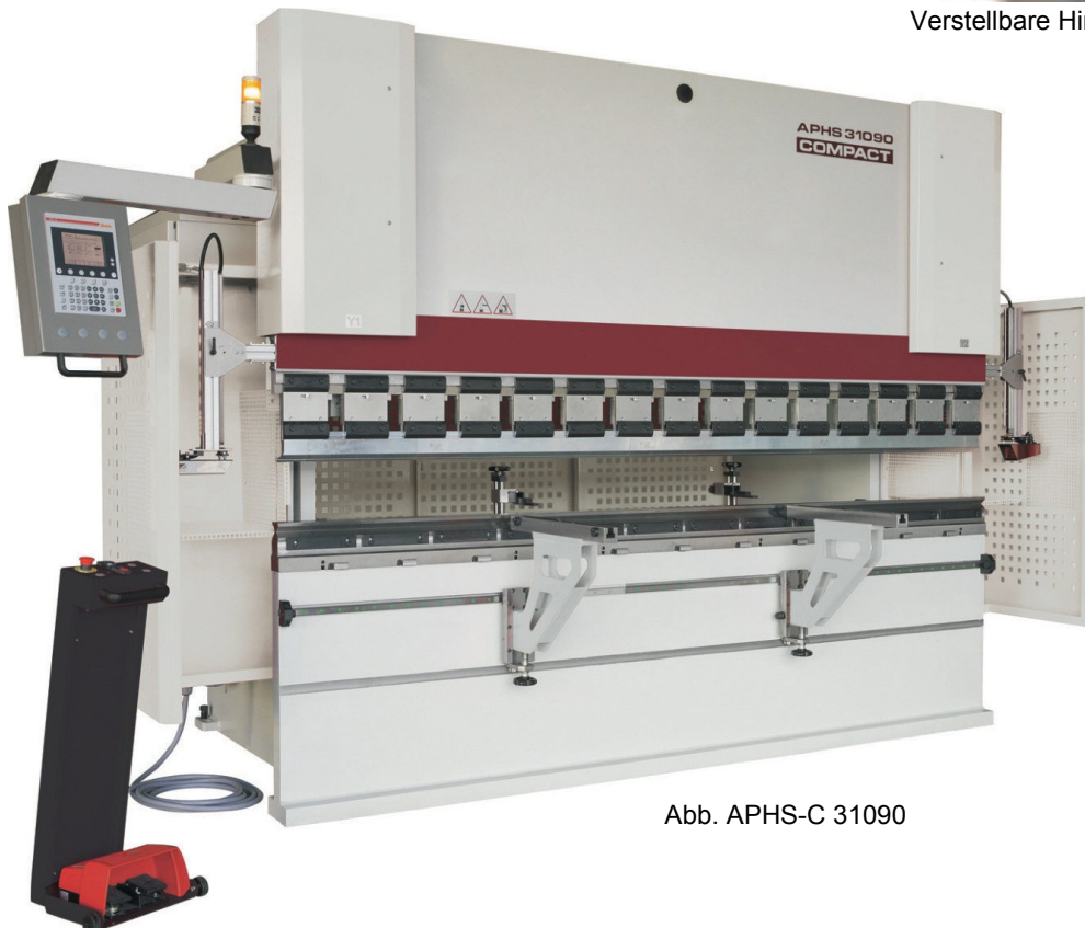
Abb. APHS-C 31090