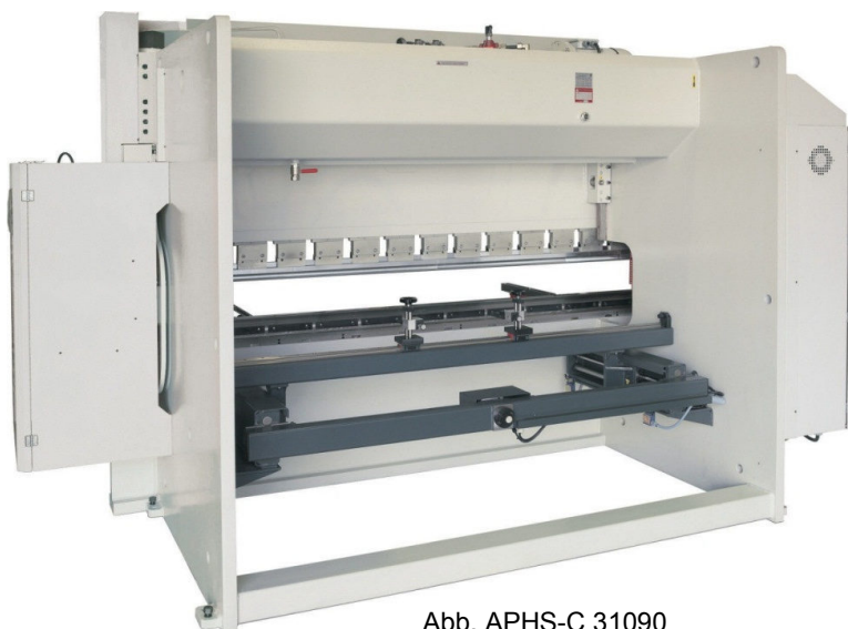
Abb. APHS-C 31090